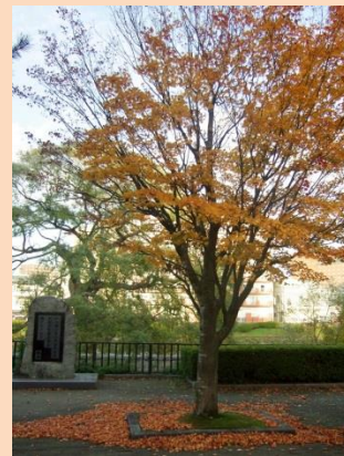
盛岡城跡公園 啄木石碑

# バスの中、一人シャッターを切り続けていました。この素敵な風景が、今の日本に残っていることに感謝！